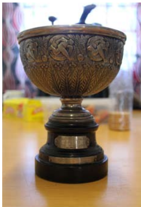
SM-pokalen 1923 hamnade på Brynäs.

Brynäs första stora framgångsår var 1917 då fotbollslaget vann Geflepokalen och bandylaget blev distriktsmästare. Nu hade man flyt och 1921 vann Brynäs DM i både fotboll och vattenpolo.