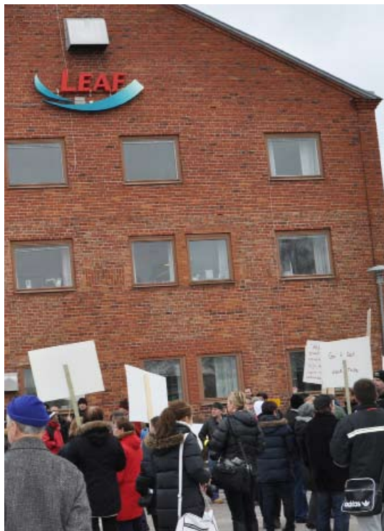
De anställda på Cloetta kämpar för sina jobb.

Vi lever i en tid då individen sätts i centrum. Det kan förstås vara smickrande, men när det kommer till att skapa något större och bestående, är det oftast kollektivet som gäller, att människor gör något tillsammans.