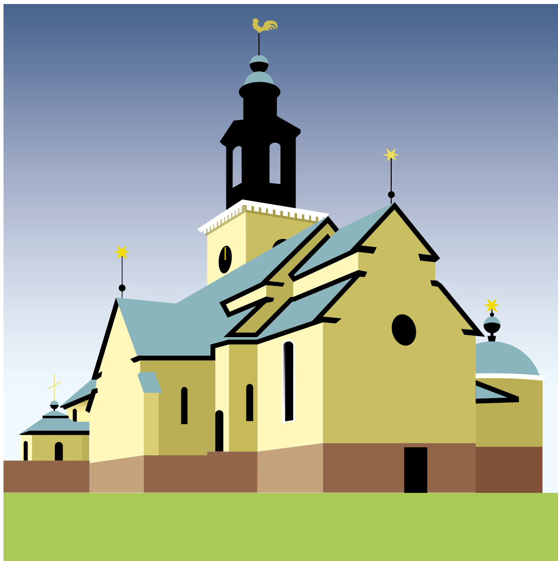
Staffanskyrkan på Brynäs firar sina 80 år den 14:e oktober.

I år är det 80 år sedan Staffanskyrkan invigdes och på tacksägelsedagen den 14 oktober ska kyrkan firas med jubileumshögmässa och stor konsert, då församlingens egna körer medverkar.