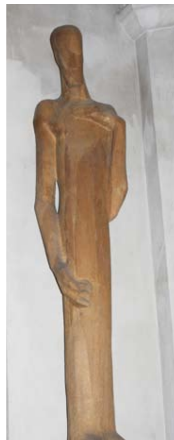
Kristusbild av Asmund Arle.

– Vi prioriterar barn och äldre och har öppen barnverksamhet tre dagar i veckan