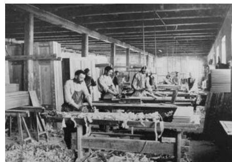
Interiör från Wahlmans snickerifabrik.

I Handboken tar den okände skribenten läsaren med på en stadsvandring och hamnar bland annat på Brynäs: ”Ser du väster