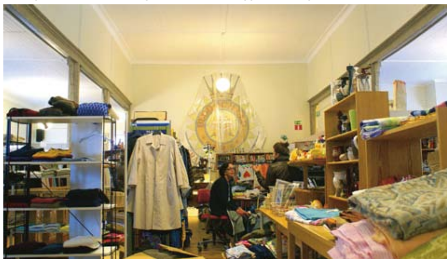
RIA finns i Frälsningsarméns f.d kyrksal. Här har många gått i söndagsskolan.

Människans öppna verksamhet vänder sig till människor som på grund av missbruk, hemlöshet, kriminalitet eller brist på fungerande nätverk befinner sig i social utsatthet. RIA är en förkortning för "Råd och Information i Alkoholfrågor" och verksamheten startade under 1950-talet. I dag rymms alla drogfrågor i RIAs arbete.