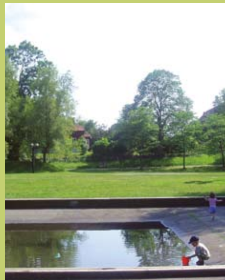
Förslaget är att den nya scenen ska byggas här, mellan träden och dammen.