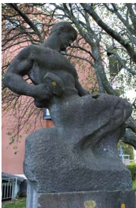
"Arbetaren" är kanske Brynäs mest anonyma skulptur. Konstnären var Michail Katz, som kom från Sovjetunionen...