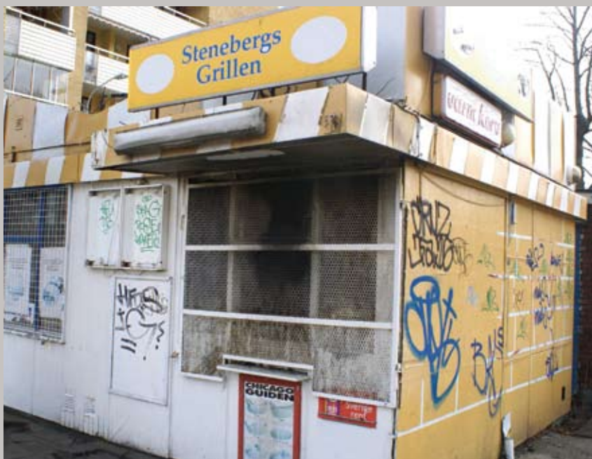
Kiosken ska byggas om och kanske bli café. Förhandlingar pågår...

Den svårt sargade kiosken i Stenebergsparken mot Brynäsgränd kommer att få nytt liv. Det blir kanske till och med ett café där. Gävle kommun förhandlar just nu med en intressent om hur ombyggnaden kan gå till. Både en arkitekt och en konstruktör är med och tittar på projektet.