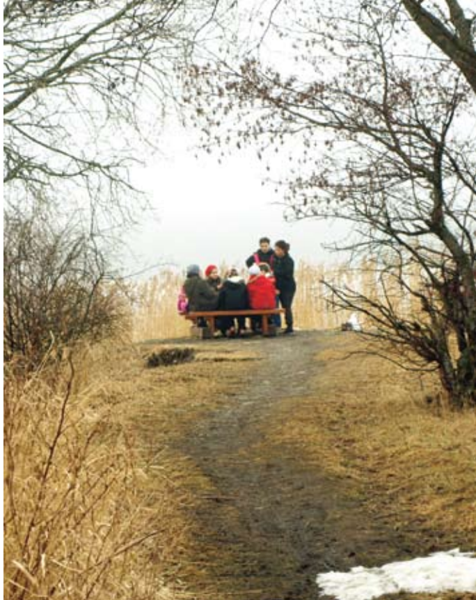
Medborgardialog på T-udden om Brynäs framtid?