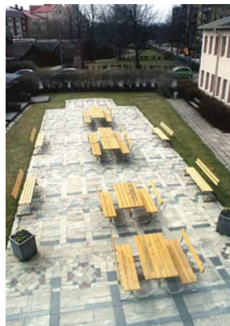
Lutande tornet på Brynäs, mosaik vid S Sjötullgatan av Olle Nyman.