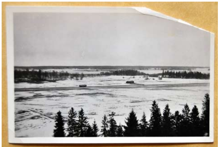
Full fart mot Bombus med spårvagn...

På möten i stadsdelarna kopierar man de gamla foton människor kommer med. Sedan gör man i lugn och ro ett urval för boken. På så sätt scannar man av folkets samlade men okända bildskatt. Bilderna