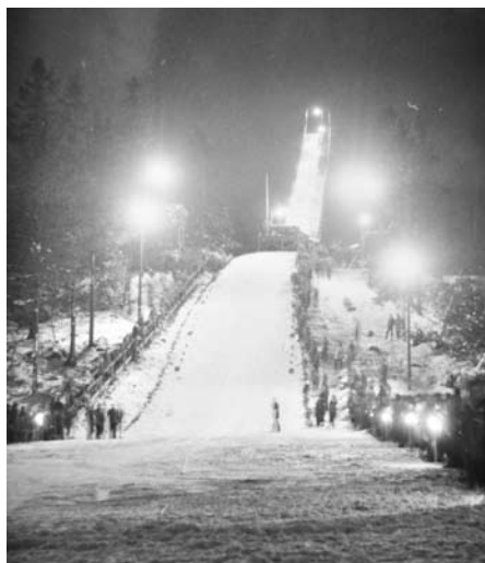
Måsbergets hoppbacke byggdes av ideella krafter. 1968 blåste backen omkull.

Från Måsbergets topp fotograferade Lars Jonsson en ensam spårvagn på väg mot Bomhus. Landskapet breder ut sig tundra-