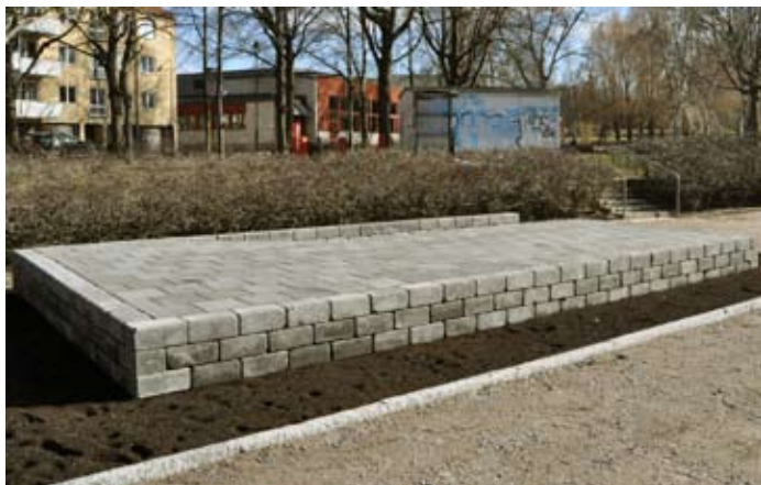
Ny scen i Stenebergsparken för musik och underhållning.