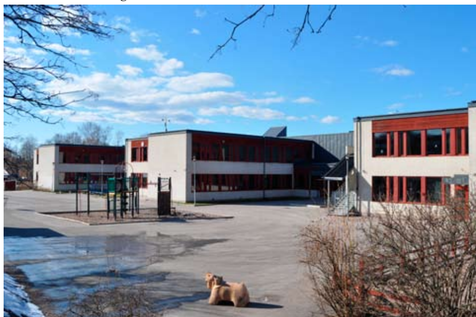
Brynäsborna har chans att diskutera med politiker från olika nämnder vid ett möte på Stenebergsskolan den 19:e maj. Se det som en demokratisk chans!