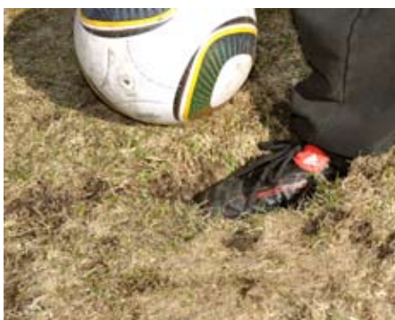
En benbrytargrop på Högbergsplan.