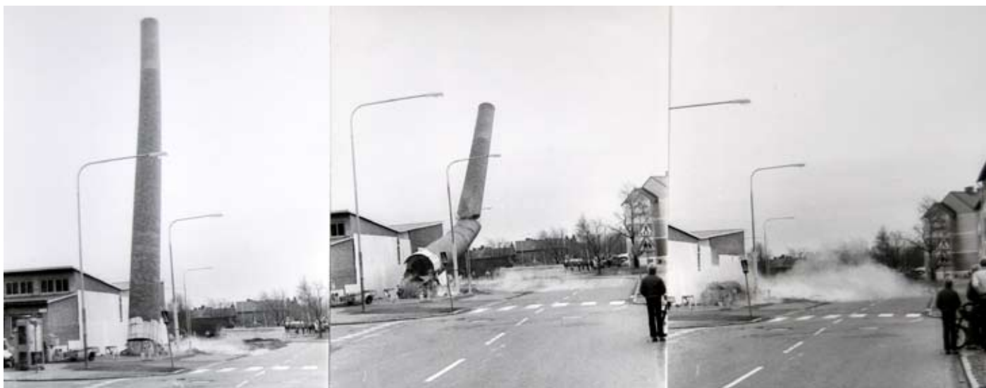
Skorstenen som sprängdes stod i hörnet Väpnargatan–Kaserngatan tills i mitten av 1970-talet, då fjärrvärmen kom.