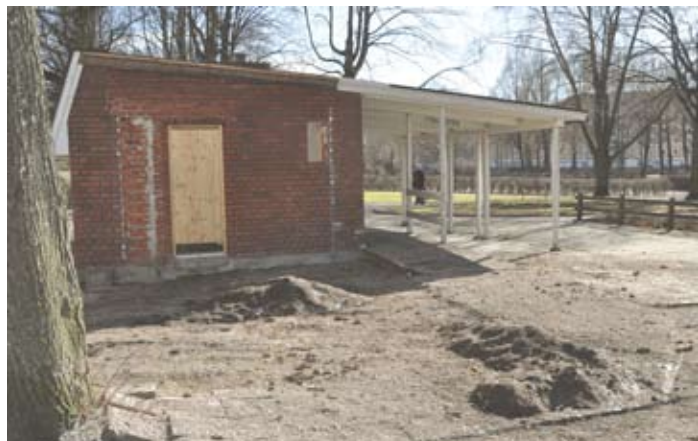
Här kommer kiosk och café att öppna i augusti.

Det kommer att hända mer i Stenebergsparken i år än det gjort på många somrar.