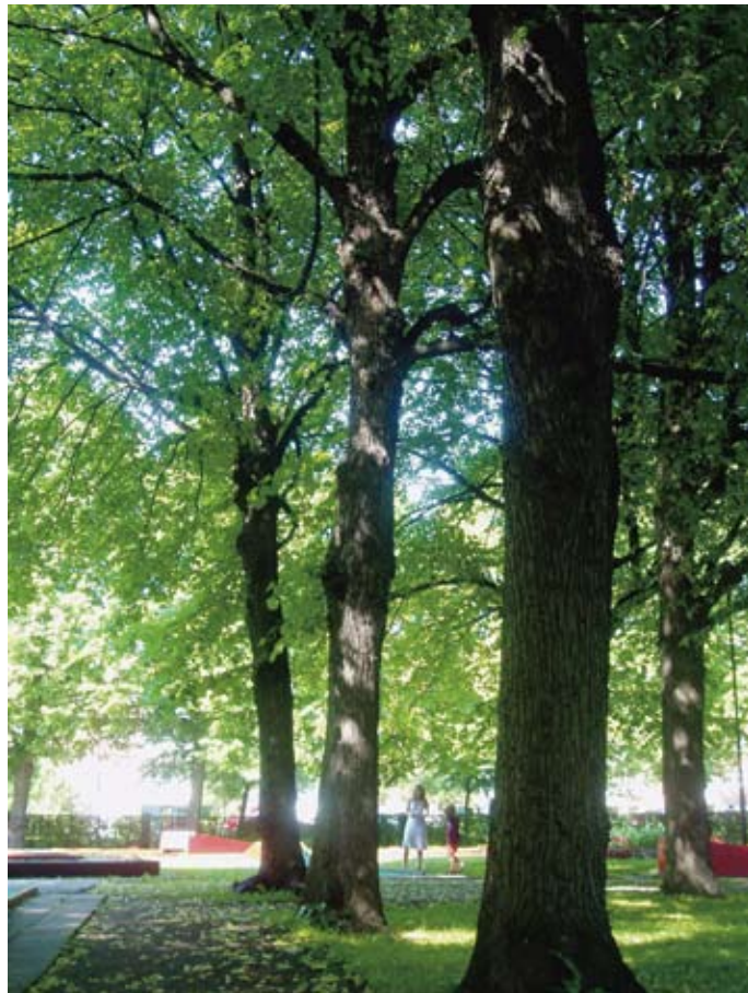
Stenebergsparken är en av Brynäs finaste mötesplatser.

Brynjan vill uppmana unga att skriva för Vi på Brynäs.