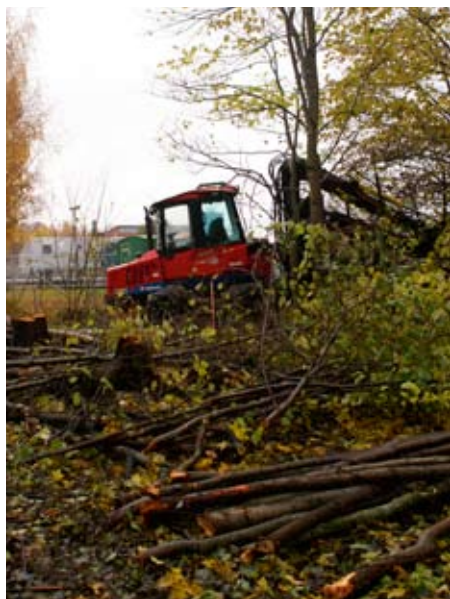
Hösten 2009 averkades delar av T-uddens lövskog, utan tillstånd.

Nu är naturreservatet T-udden på gång. I dagarna har Bygg & Miljö skickat ut ett förslag på vad reservatet ska skydda och hur det ska gå till. När alla sagt sitt är det dags att göra T-udden till kommunalt naturreservat tillsammans med Herrgårdshagen, åkermarken mot Bomhus och Duvbackens våtmark.