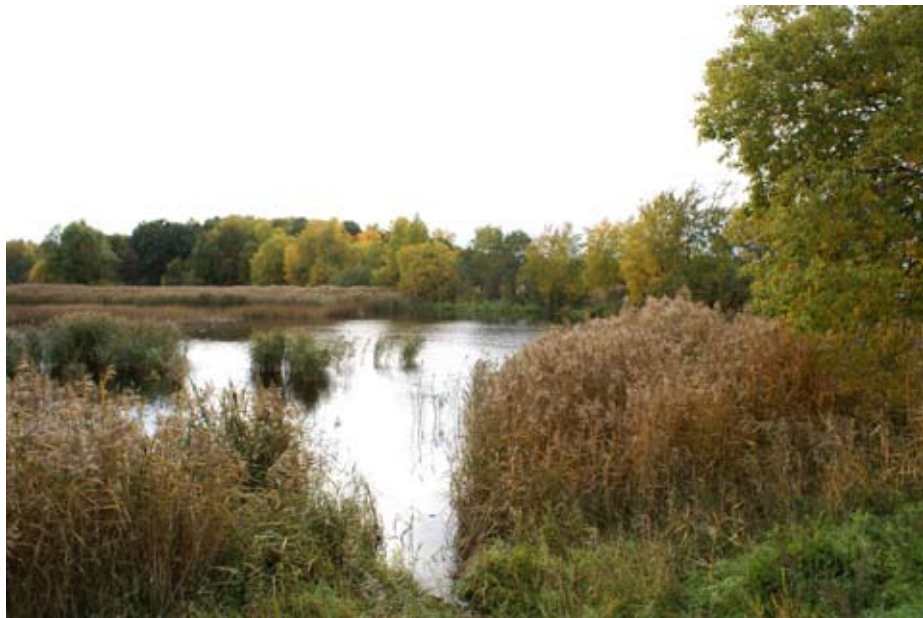
I vassviken på T-udden föreslår Gävle kommun plats för båtar.

Nu är naturreservatet T-udden på gång. I dagarna har Bygg & Miljö skickat ut ett förslag på vad reservatet ska skydda och hur det ska gå till. När alla sagt sitt är det dags att göra T-udden till kommunalt naturreservat tillsammans med Herrgårdshagen, åkermarken mot Bomhus och Duvbackens våtmark.