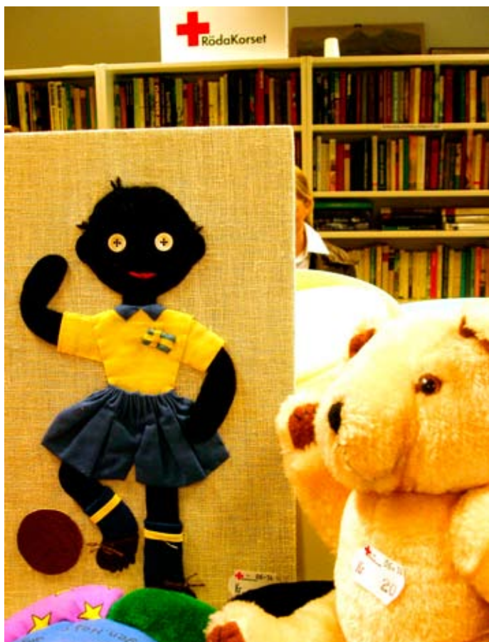
Från Kupan - Röda korsets mötesplats i Brynäs centrum.