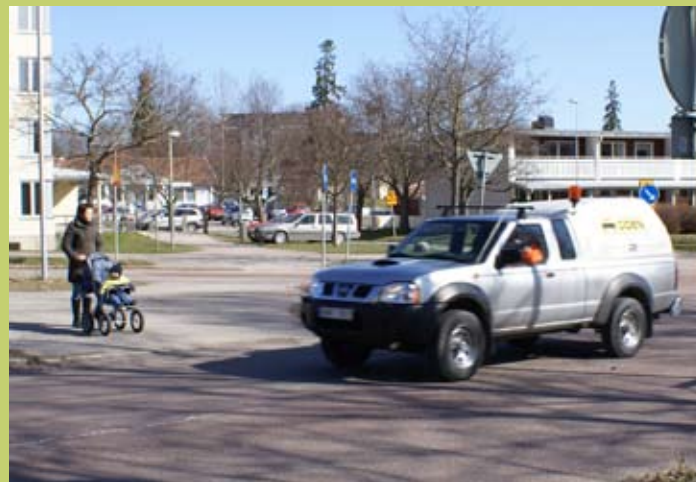
Kaserngatan – Brynäsgratan är fortfarande en otrygg passage.

Ida Forslund frågade också om de intervjuade lagt märke till de insatser Gävle kommun gjort som en följd av trygghets-