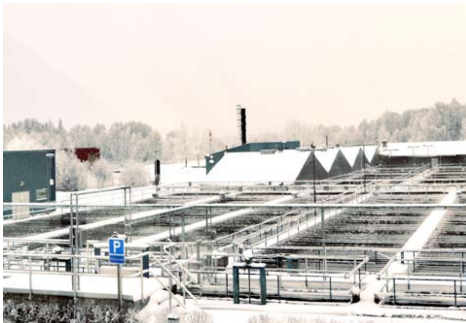
Gasen från Duvbackens röt-kammare (under taken) kan användas till bussbränsle.

Duvbackens avloppsreningsverk på Brynäs kan snart förse fem av lokaltrafikens busar och ett antal personbilar med biogas gjord på reningsverkets rötgas. Det blir ett miljöanpassat kretslopp som börjar på toaletten.