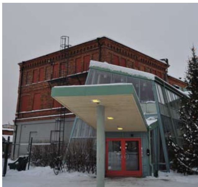
Buller och lukt från Leaf är inga problem för nya bostäder på Södra Skeppsbron, enligt Gävle kommun.

utredning om möjligheterna att förverkliga planerna på att bygga bostäder. Det bör gå, är utredningens slutsats, även om det finns en del att ta ställning till – miljögifter, buller, stoftutsläpp och godislukter från Leaf, som gränsar till det tilltänkta bostadsområdet.