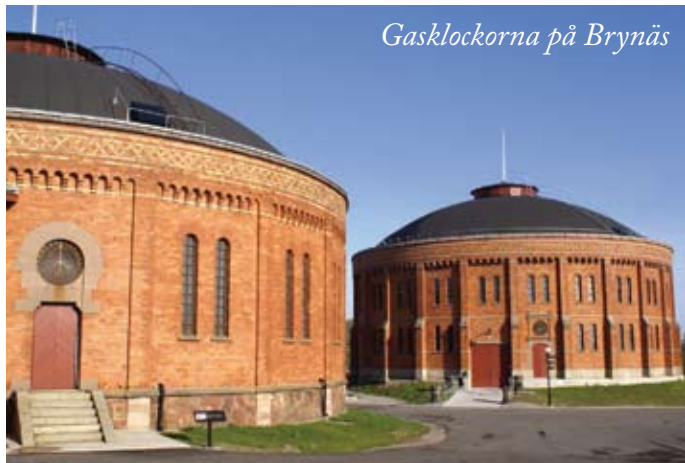
Gasklockorna på Brynäs

Alla involverade i Brynäsprocessen ska sprida information om mötesplatser om verksamheter och aktiviteter.