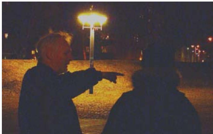
Trygghetsvandring på Brynäs.