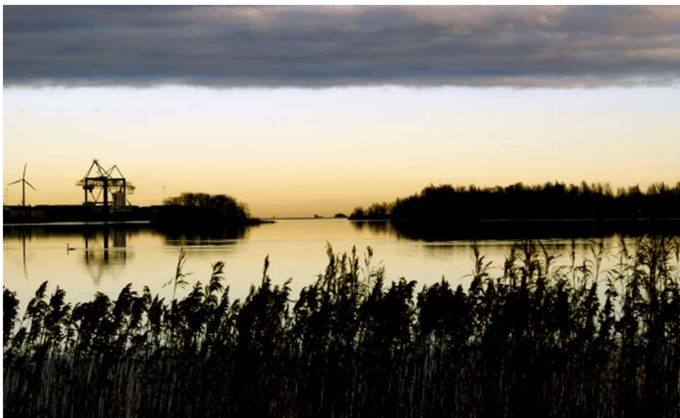
Natt på T-udden. Ett blivande naturreservat på Brynäs.