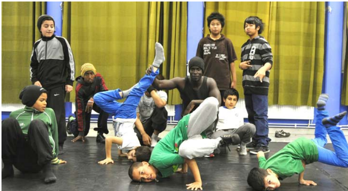
På måndagskvällarna tränar killarna breakdance på Brynjan. Det gäller att hitta sin stil.