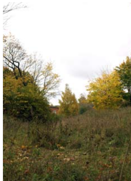
Grillplats föreslås för Herrgårdshagen.

I Herrgårdshagen tänker man sig att en grillplats med bänkar och bord och ett